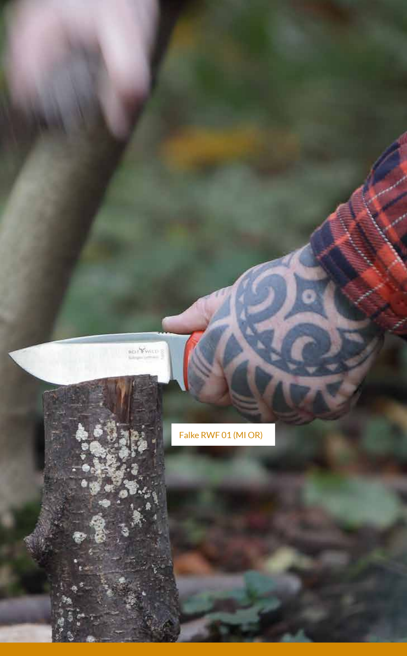
Falke RWF 01 (MI OR)