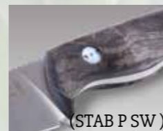
(STAB P SW)

Klingenmaterial: Böhler N690 Klingenstärke: ca. 3,5 mm Griffmaterial: Stabilisierte Pappel* (STAB P SW) Micarta schwarz (MI) Micarta orange (MI OR) Hirschhorn (HH) Klingenlänge: ca. 85 mm Gesamtlänge: ca. 200 mm Gewicht: ca. 130 g