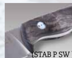
(STAB P SW)

Klingenmaterial: Böhler N690 Klingenstärke: ca. 3,5 mm Griffmaterial: Stabilisierte Pappel* (STAB P SW) Micarta schwarz (MI) Micarta orange (MI OR) Hirschhorn (HH) Klingenlänge: ca. 99 mm Gesamtlänge: ca. 225 mm Gewicht: ca. 174 g