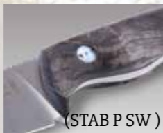
(STAB P SW)

Klingenmaterial: Sandvik 14C28N Klingenstärke: ca. 2,8 mm Griffmaterial: Stabilisierte Pappel* (STAB P SW) Hirschhorn (HH) Micarta grün (MI GR) Klingenlänge: ca. 92 mm Gesamtlänge: ca. 200 mm Gewicht: ca. 90 g