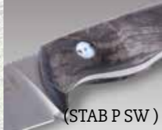
(STAB P SW)

Klingenmaterial: Böhler N690 Klingenstärke: ca. 5mm Griffmaterial: Stabilisierte Pappel* (STAB P SW) Micarta schwarz (MI) Micarta orange (MI OR) Hirschhorn (HH) Klingenlänge: ca. 117 mm Gesamtlänge: ca. 255 mm Gewicht: ca. 240 g