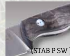
(STAB P SW)

Klingenmaterial: Böhler N690 Klingenstärke: ca. 5 mm Griffmaterial: Stabilisierte Pappel* (STAB P SW) Micarta schwarz (MI) Micarta orange (MI OR) Hirschhorn (HH) Klingenlänge: ca. 112 mm Gesamtlänge: ca. 245 mm Gewicht: ca. 293 g